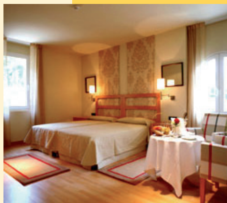
Interior d'una habitació.