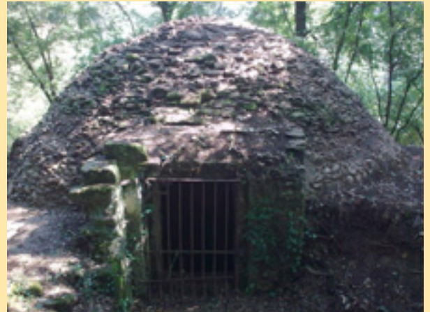
El Pou de Glaç en fase de restauració un cop extreta la coberta vegetal que el cobria.

Per visitar l'interior del pou de glaç poseu-vos en contacte amb l'Ajuntament de les Masies de Roda. Tlf. 938540027 a/e: masiesr@diba.cat