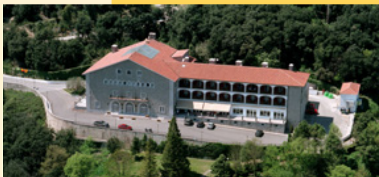
Vista del Parador de les Masies de Roda.