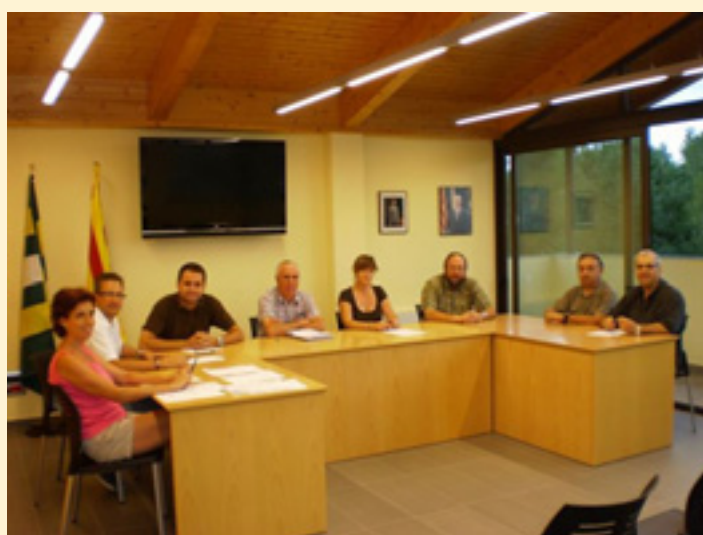
Ple ordinari del passat 30 d'agost de 2010.

El Ple per unanimitat acorda ratificar la resolució de 21 de juny de 2010, pel qual s'apliquen les mesures de reducció de les retribucions del personal de l'Ajuntament a partir de la nòmina del mes de juny, d'acord amb el que preveu el RDL 8/2010 pel qual s'adopten mesures extraordinàries per a la reducció del dèficit públic i que resulta d'aplicació directa a tots els ajuntaments i d'altres ens locals.