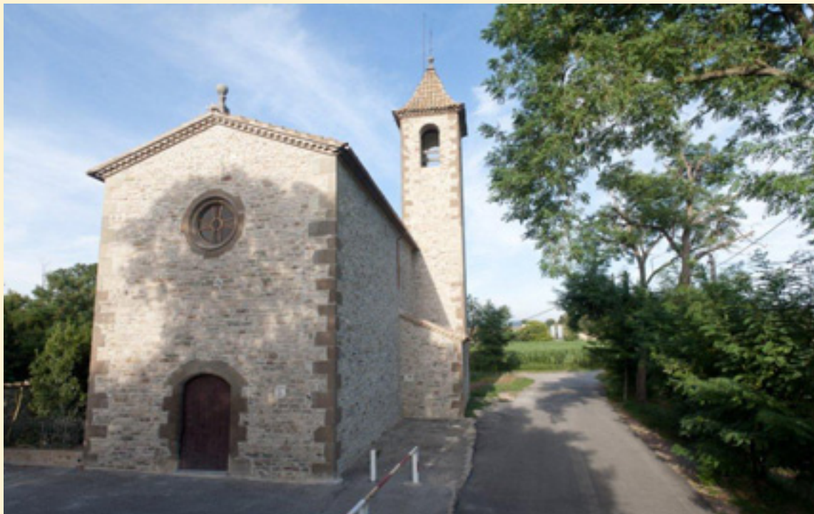
Imatge de l'església un cop restaurada.

Després de tres mesos d'obres el proper dia 29 de setembre a les 12 hores s'inaguraran les obres de restauració de la sufragània de Sant Miquel de la Guàrdia.