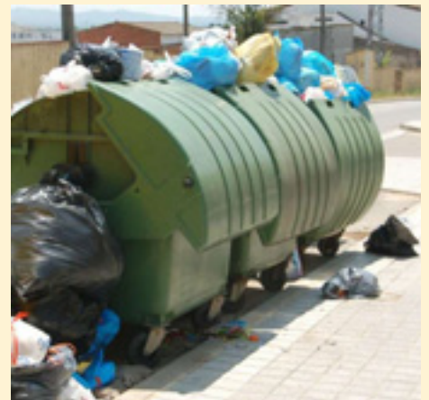
El mal ús dels contenidors ens perjudica a tots.

També es recorda que està prohibit tirar en els contenidors animals morts, ja que en les últimes setmanes s'han localitzat peixos morts en els contenidors del barri de les Cases Noves.